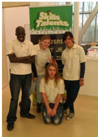
Skills Talents 2011